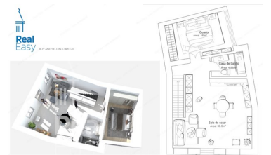
Apartamento T1 em Tavira - Refª RE143 www.realeasy.pt